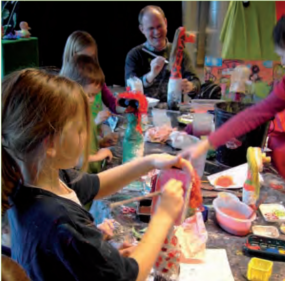
Knutselen met afval in het EcoHuis